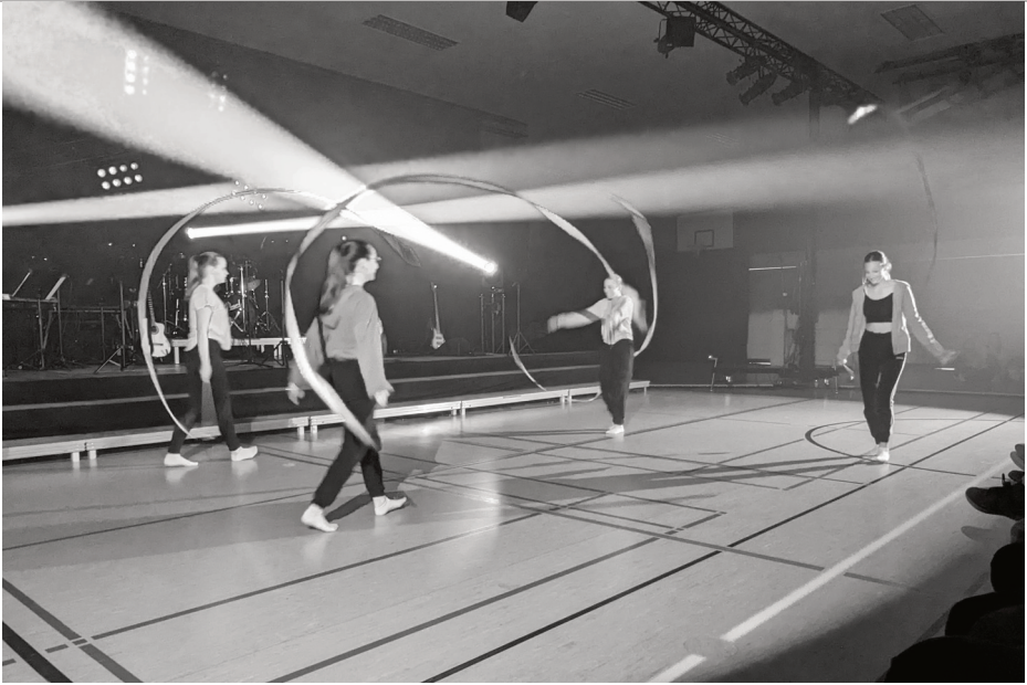
Der Circus Gymnasticus beim Auftritt 2023 (Seite 16)