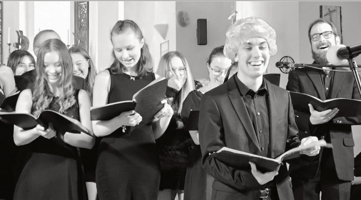
Der Chor auf dem Sommerkonzert, die Schülerfirma bei der Schulhauseinweihung (2023)