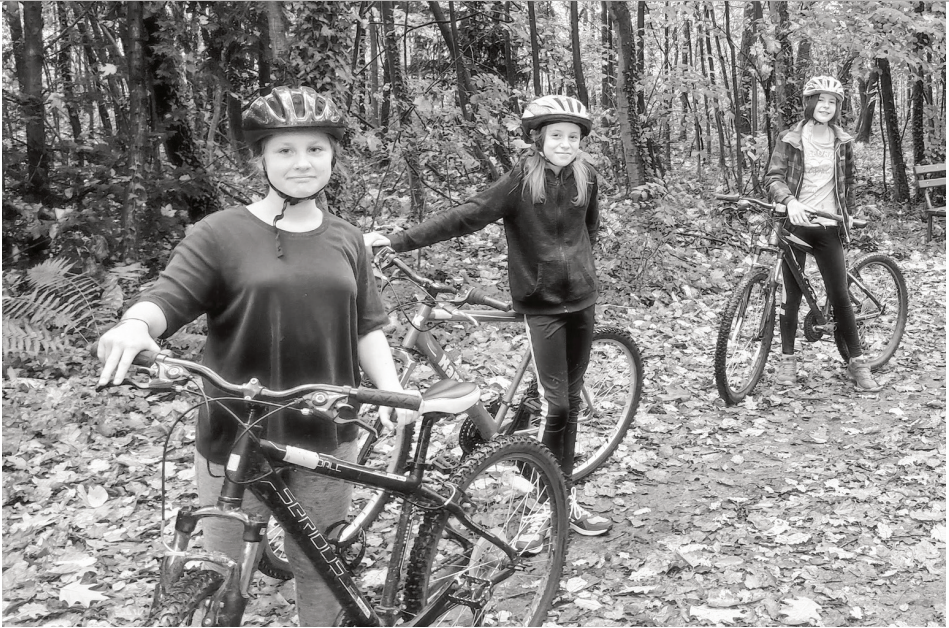
Triathlon Training 2023 (Seite 15)